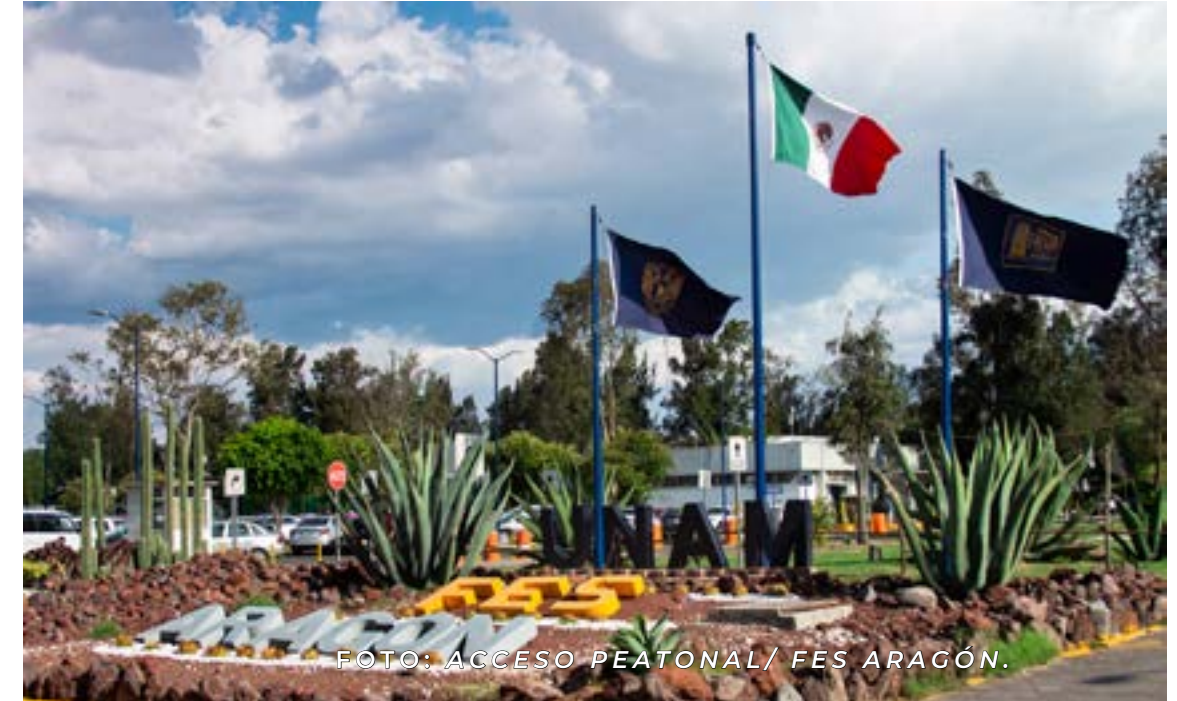
FOTO: ACCESO PEATONAL/ FES ARAGÓN.