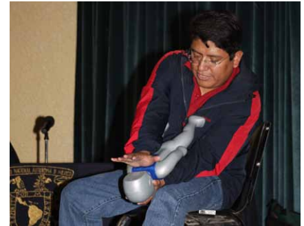
Auxilio a un bebé con obstrucción de las vías respiratorias.