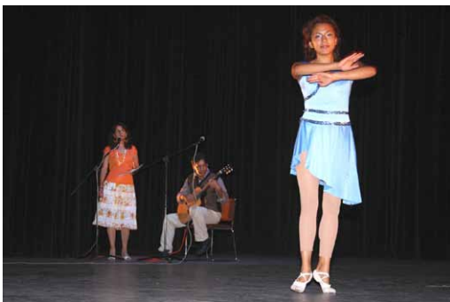
Una muestra de talento.