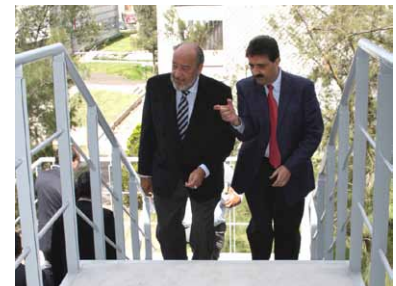
Nuevas escaleras.