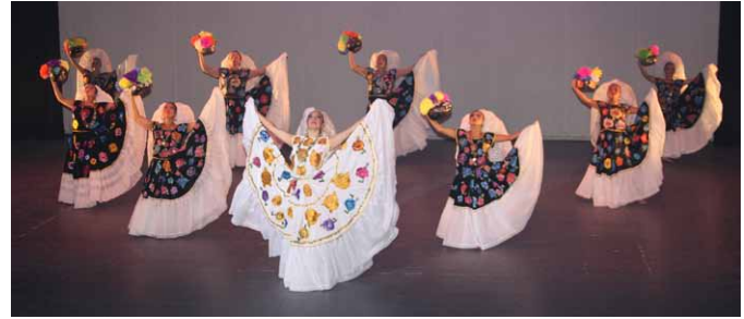
Oaxaca y su tradicional folklore.