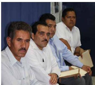
En la entrega de constancias.