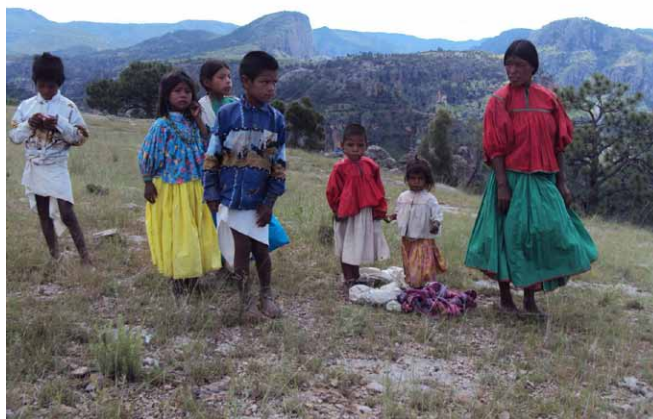
Pobreza entre los indígenas.