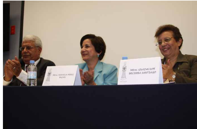
Docentes fundadores comparten vivencias académicas.