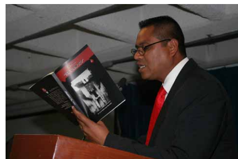
El Mtro. Casas Reséndiz compartió fragmentos de su novela.