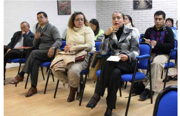
El aula magna de Posgrado alberga eventos académicos de diversa índole.