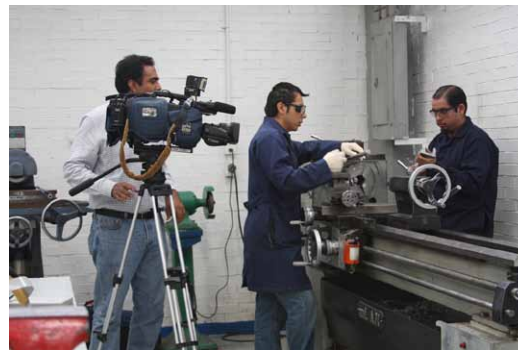
Demostración de fabricación de herramienta.

La entrevista tuvo lugar el 14 de septiembre en el laboratorio L-1 y el estacionamiento del plantel, donde los jóvenes explicaron el funcionamiento del compresor para pistón de caliper trasero, proyecto que les llevó aproximadamente tres meses de trabajo.