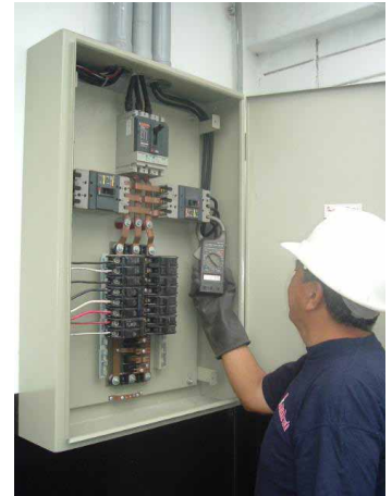
Alternativas productivas para ex trabajadores de LyFC.