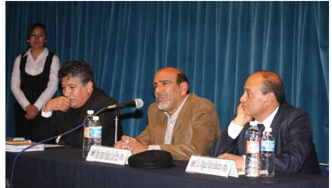
La transición democrática marcó el inicio del Estado fallido.

En la conferencia Teoría del Estado se expusieron los lineamientos que siguen las legislaturas para valorar las